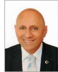
Osman BEKAROĞLU Cumhuriyet Halk Partisi