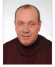
Lütfi ÇAVUŞ Adalet ve Kalkınma Partisi