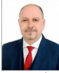
Bünyamin BABAİBAN Adalet ve Kalkınma Partisi