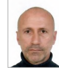
Hasan ŞENOL Cumhuriyet Halk Partisi