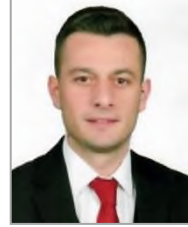
Onur TURGUT Adalet ve Kalkınma Partisi