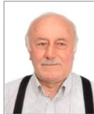
Mustafa KILIÇ Cumhuriyet Halk Partisi