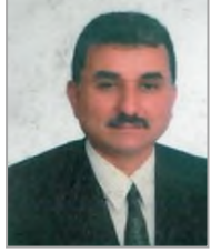
Hüseyin KAHVECİ Adalet ve Kalkınma Partisi