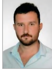
Uğur SARIKAN Adalet ve Kalkınma Partisi