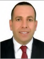
Gökhan ÇÜTELİ Adalet ve Kalkınma Partisi