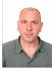
Hürmet KARTAL Cumhuriyet Halk Partisi