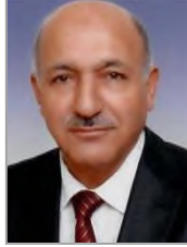
İbrahim CANSIZ Adalet ve Kalkınma Partisi